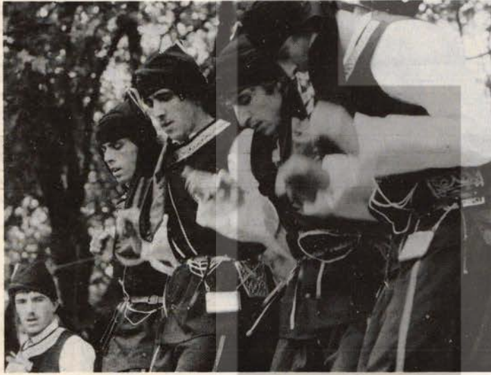
Gelsenkirchen-Horst Sosyalist Gençler'inin oluşturduğu Karadeniz Folklor Ekibi büyük ilgi topladı...