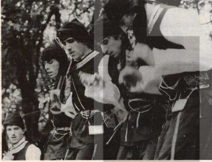
Gelsenkirchen-Horst Sosyalist Gençler'inin oluşturduğu Karadeniz Folklor Ekibi büyük ilgi topladı...